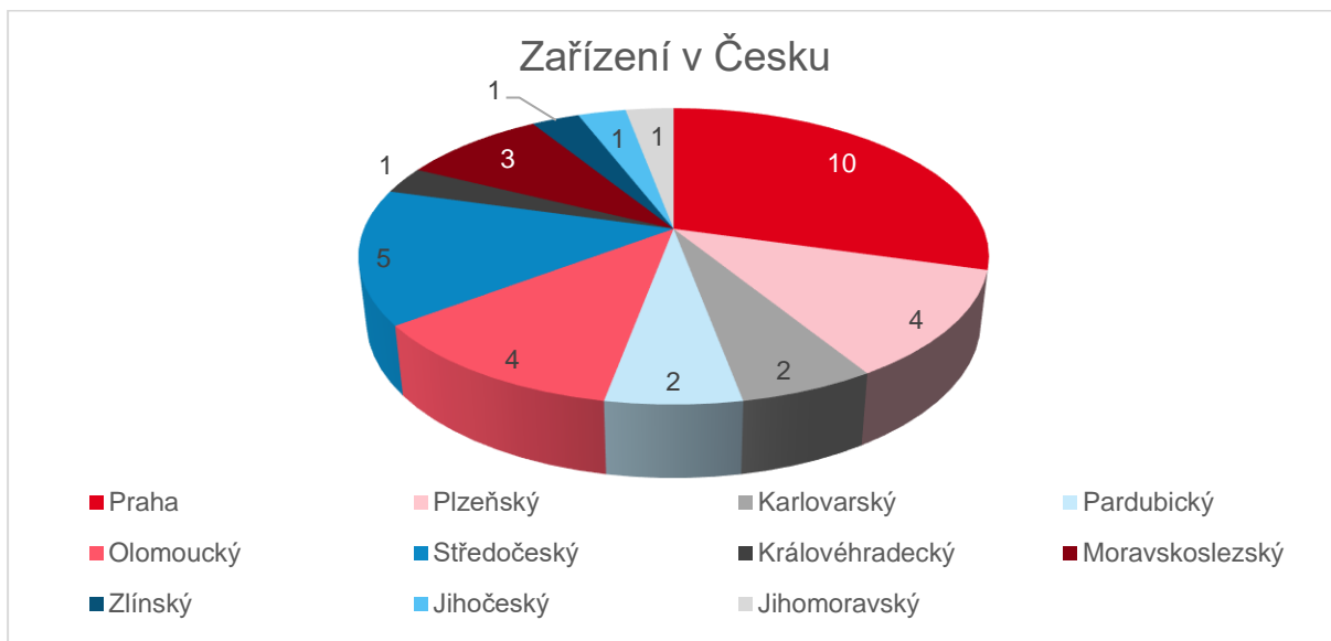
Obr. 3: Zapojení zařízení v rámci krajů v Česku

Na prvním místě se situace nezměnila. Většina zařízení pochází nadále z hlavního města Praha. Druhé místo zaujímá Středočeský kraj s 5 zařízeními.