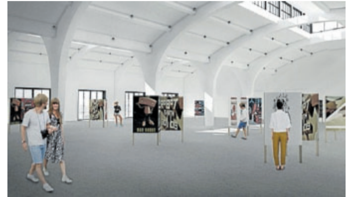
ZAMÝŠLENÁ PODOBA Tech Toweru. Vizualizace: MMP

Také vedení města vidí v projektu přínos pro budoucnost. „Dnes zde máme mnoho firem, které nevytvářejí přidanou hodnotu, ve výzkumu nebo inovacích. Po-